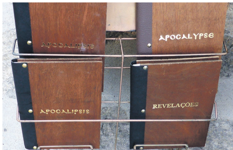
ATT PATMOS är ett populärt resmål för kristna från världens alla hörn märks i utbudet i affärerna vid promenadstråken.

– Motståndarna beskrivs ju ofta som icke-människor, djur, bestar – något som är typiskt för modernt hat-tal. Också allegorin om ”Babyloniska horan” är motbudande.